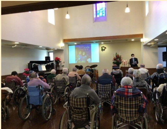
衣笠病院グループ チャプレン室室長