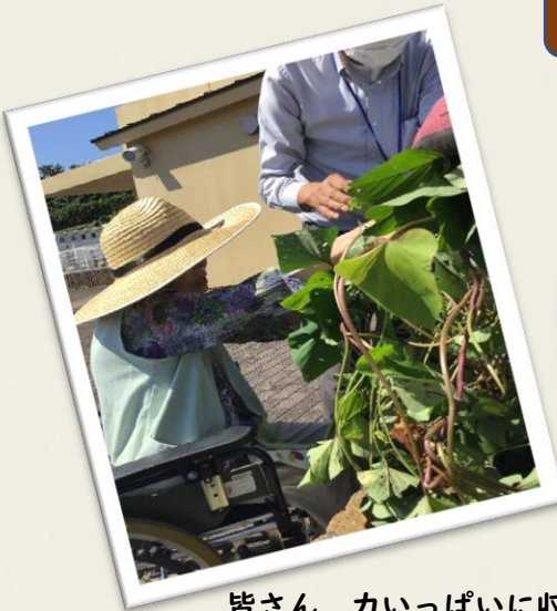
皆さん、力いっぱい収穫を 楽しまれていました😊