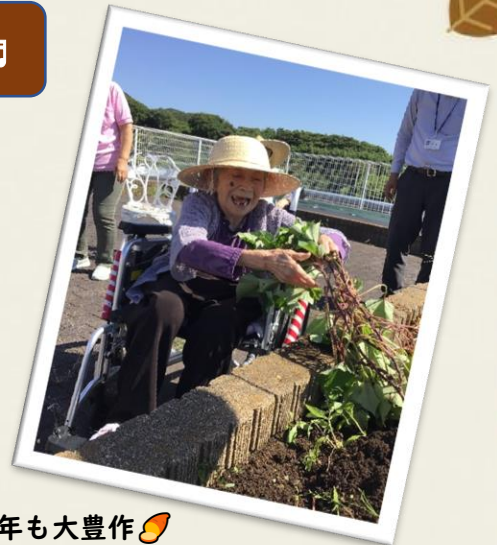
今年も大豊作🍠 「笑顔が最高～♪」